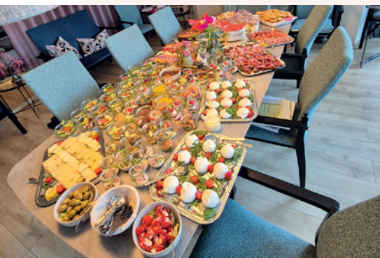
Italienische Spezialitäten warten auf die Gäste