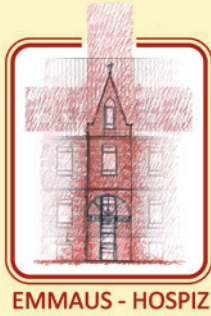
EMMAUS - HOSPIZ